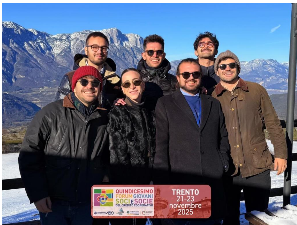
(in foto i Giovani Soci che hanno partecipato al Forum 2025)