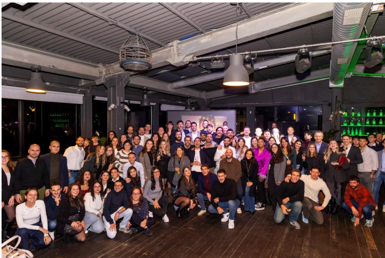
(in foto i Giovani Soci presenti durante la serata)